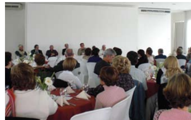
Taubaté: associados do Grupo C lotaram o auditório